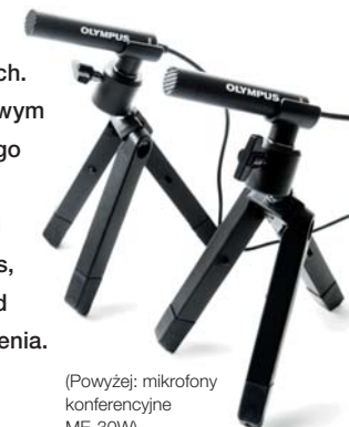
(Powyżej: mikrofony konferencyjne ME-30W)

Wyraźny i precyzyjny zapis dźwięku w dużych przestrzeniach. Dzięki oddzielnym, niskoszumowym mikrofonom dla lewego i prawego kanału, zestaw ten, gdy jest używany razem z zaawansowanymi systemami nagrywania Olympus, pozwala zapisać dźwięk dochodzący z każdej strony pomieszczenia. Dzięki zapisaniu każdego szczegółu już nigdy nie utracisz żadnej wartościowej informacji.