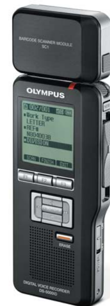
(Powyżej: dyktafon DS-5000iD z podłączonym modułem skanera kodów kreskowych SC1)

Ten opcjonalny moduł dla dyktafonów DS-5000 / DS-5000iD pozwala zwiększyć poziom bezpieczeństwa podczas pracy z nagraniem. Przed rozpoczęciem nagrania wystarczy zeskanować kod kreskowy odpowiedniej sprawy. Nagranie zostanie automatycznie przesłane do odpowiedniego rekordu dla danej sprawy w systemie IT.